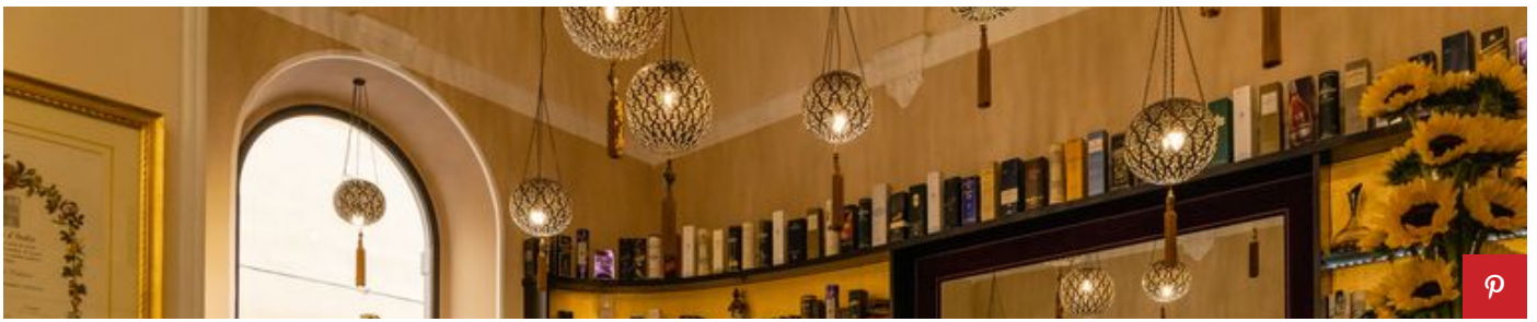
Il Lounge Bar dell'Hotel Bernini Palace.