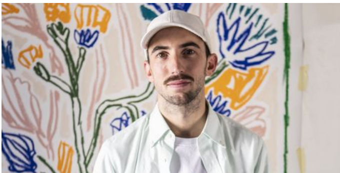
Gioie e colori