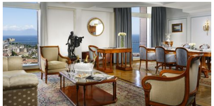
Charme e cucina stellata

PUBBLICITÀ - CONTINUA A LEGGERE DI SEGUITO