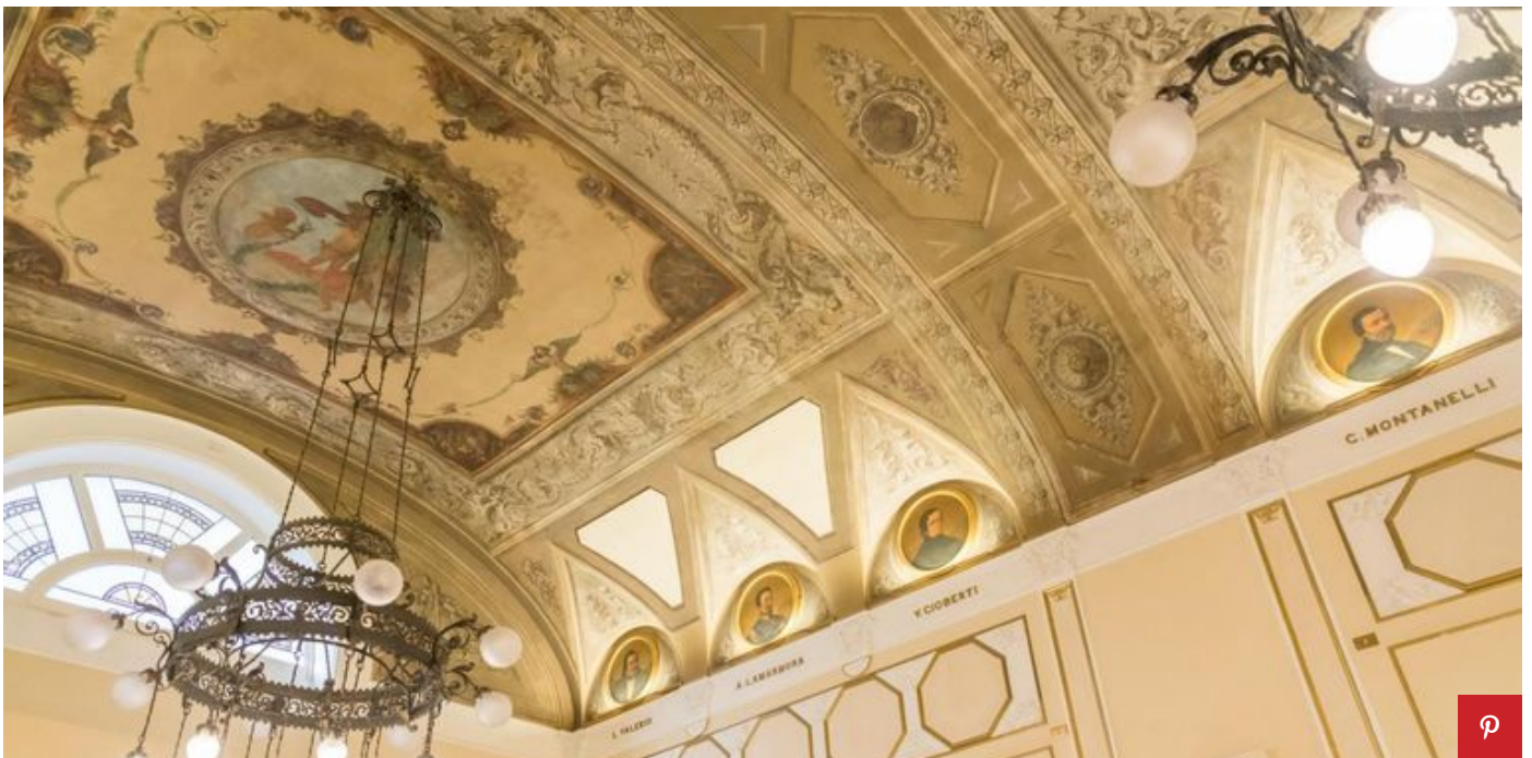
La Sala Parlamento con i medaglioni affrescati coi volti di personaggi storici.