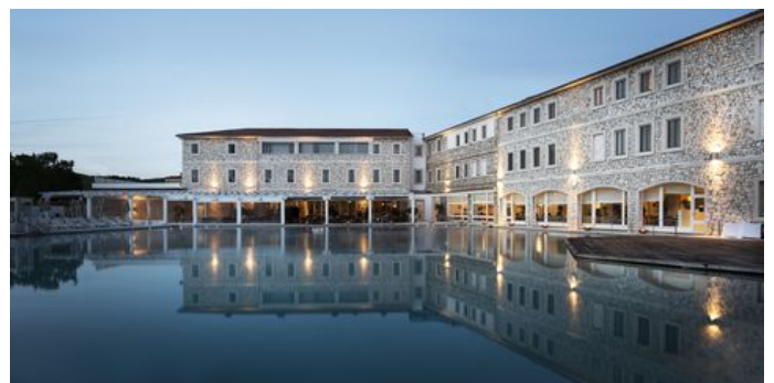
Oasi body & soul