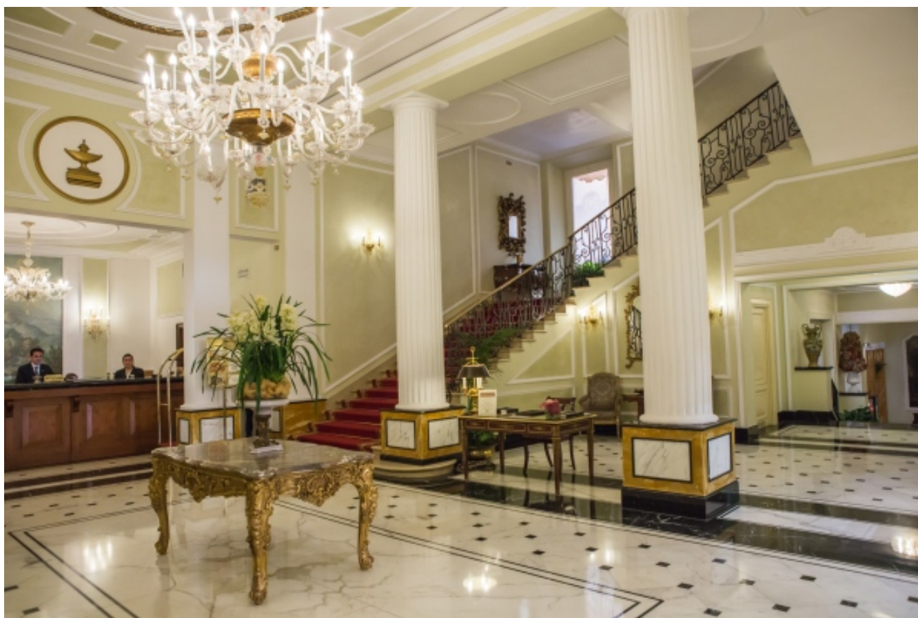
Il Grand Hotel Majestic a Bologna